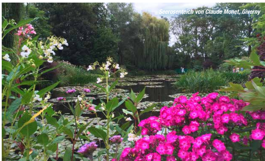
Seerosenteich von Claude Monet, Giverny