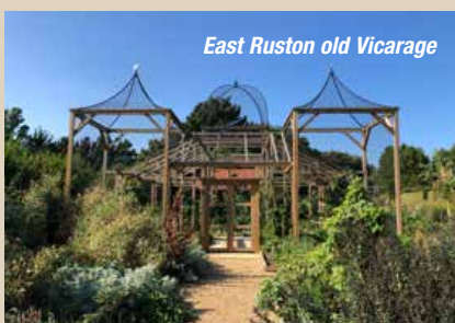
East Ruston old Vicarage