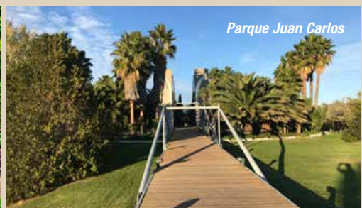
Parque Juan Carlos