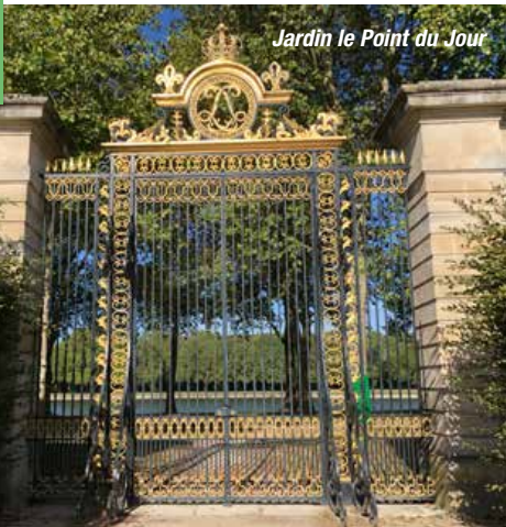
Jardin le Point du Jour

Eiffelturm, Montmartre, Seine und natürlich die prächtigen Boulevards – das ist Paris. Für viele die Stadt der Liebe – in diesem Fall: die Stadt der Liebe zu den Gärten. Vier Tage lang sind Sie nicht nur der französischen Lebenslust, sondern auch den versteckten privaten, grünen Paradiesen auf der Spur. Ein besonderes Highlight stellt der Besuch der Britischen Botschaft dar, in die Ihnen nur aufgrund der guten Beziehungen von TV-Biogärtner Karl Ploberger Zutritt gewährt wird.