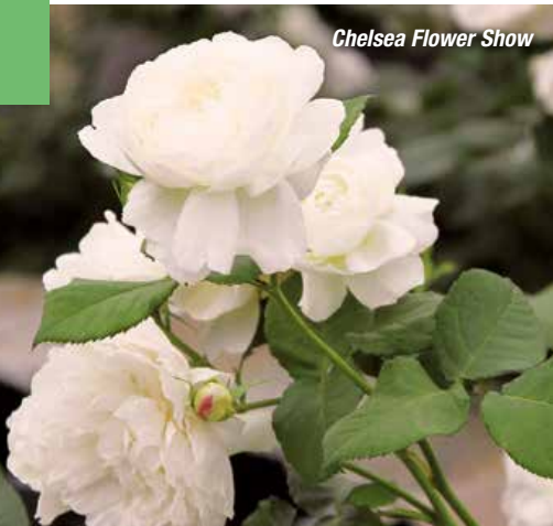
Chelsea Flower Show