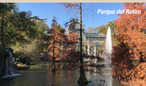
Parque del Retiro

29.04.: Nach dem Frühstück unternehmen Sie eine Stadtrundfahrt, bei der Sie die wichtigsten Sehenswürdigkeiten besichtigen. Mit dabei ist