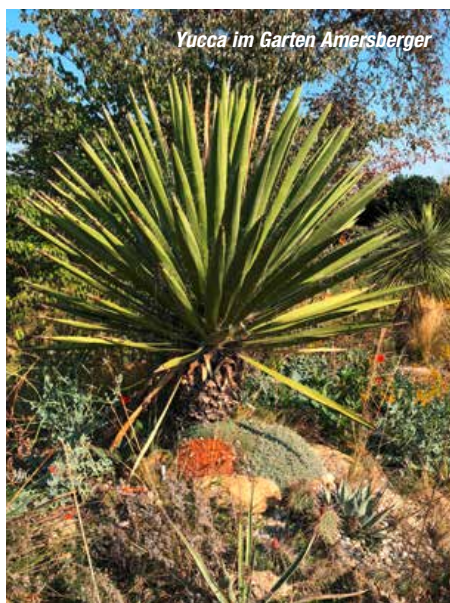
Yucca im Garten Amersberger

genügend Zeit, um Pflanzen einzukaufen, bevor es zurück nach Budapest geht. Für alle, die gerne eine außergewöhnliche Thermalanlage besuchen wollen, besteht in Budapest die Möglichkeit individuell das Széchenyi Bad zu besuchen - der Bus fährt direkt zum Hotel zurück. Diese großzügige historische Wellnessanlage, die im neoklassizistischen Stil errichtet wurde, umfasst zahlreiche Thermalbecken im Innen- und Außenbereich. Sie ist ein vielbesuchter Treffpunkt der Budapester. Der Abend steht zur freien Verfügung. Im Hotel wird ein Abendessen auch à la carte angeboten.