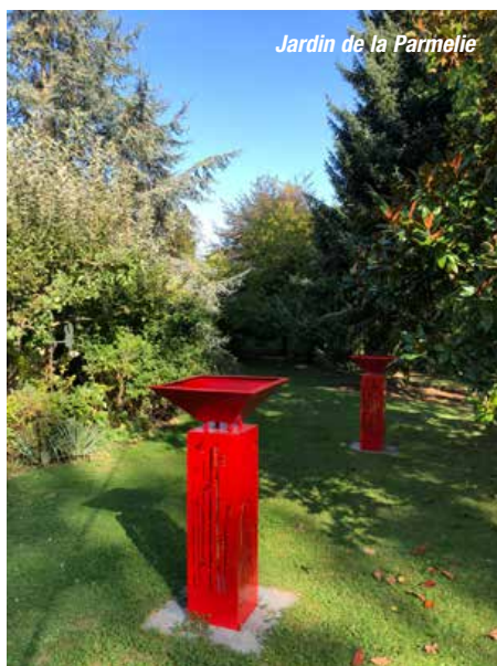
Jardin de la Parmelie

Japon“ entstehen lassen. Ihr Lebenspartner, der mehr Schauspieler als Gärtner ist, wird Ihnen die Zeit in diesem Garten unvergesslich machen. Die gärtnerisch-kulinarische Reise führt Sie anschließend in den JARDIN DES AUBEPINES der Familie LAMBERT. Aus den Ideen unzähliger Gartenreisen und der Leidenschaft, Pflanzen zu sammeln, ist ein perfekt gestalteter Hausgarten geworden, der einem Botanischen Garten um nichts nachsteht. Akkurat geschnittene Gehölze, perfekt beschriftete Pflanzen und exakt gestochene Beetkanten zeugen von einer ausgeprägten Gartenliebe. Bei Kaffee und Kuchen lassen Sie den Nachmittag ausklingen. Der Abend in Paris steht Ihnen zur freien Verfügung.