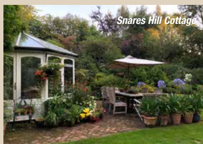
Snares Hill Cottage