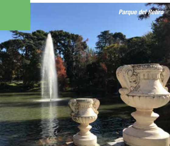
Parque del Retiro

Paradiese voller Düfte und Farbenpracht, gepflegte Parkanlagen und Oasen meisterlicher Gartenkunst – Madrid blüht. Auf dieser Reise entfliehen Sie dem Grau der Stadt und begeben sich mit TV-Biogärtner Karl Ploberger auf botanischen Streifzug. Sie besuchen historische Gartenanlagen, königliche Refugien und moderne Grünareale, deren Inspiration keine Grenzen kennt. Besonders interessant für Pflanzenliebhaber/innen ist die Vielfalt an außergewöhnlichen Gewächsen, die auch mit extremen Witterungsbedingungen zurechtkommen. Eine Gartenreise inklusive Kulturprogramm erwartet Sie.