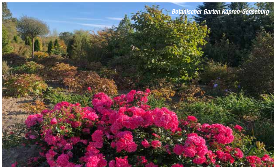
Botanischer Garten Kapron-Genseburg

Mit viel Liebe hat sie hier in über 20 Jahren einen 6.000 m 2 großen Garten errichtet, bei dem die würzigen und heilenden Pflanzen im Mittelpunkt stehen. Begonnen hat alles deshalb, weil ihre Kinder immer Probleme mit der Ernährung hatten. Kaum hatte sie mit der „Kräuterküche“ begonnen, wurden sie gesund. Sie wird Ihnen viel über die Heilkraft der Kräuter berichten und weiters ein gesundes Menü servieren. Ihre letzte Station auf Ihrer Entdeckungsreise durch Mecklenburg - Vorpommern führt Sie in ein blühendes Staudenparadies. ULRIKE GÜRTLER, eine studierte Statistikerin und gelernte Berliner Gärtnerin, bewirtschaftet alleine auf einigen tau-send 1.000 m 2 eine Gärtnerei in Peckatel mit einem üppigen Staudenmutterpflanzen-Quartier. Phloxe, Lavendel, Edeldamander, Bergenien und viele andere Stauden stehen hier in wunder-baren Kombinationen. Das größte Anliegen der Staudengärtnerin: den richtigen Standort für die Pflanzen wählen. Sie experimentiert deshalb mit den unterschiedlichsten Bodenverhältnissen und versucht immer neue Erfahrungen zu sammeln. Anschließend geht es zum Flughafen Berlin-Tegel für Ihren Rückflug nach Wien. ■