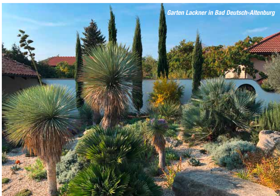
Garten Lackner in Bad Deutsch-Altenburg