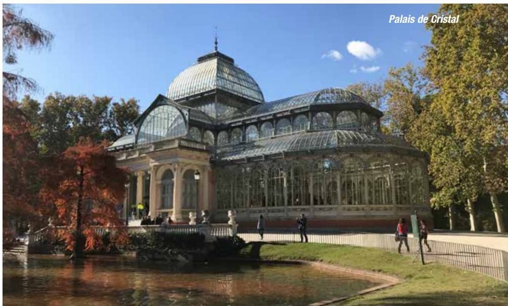
Palais de Cristal

27.04.: Nach einem Flug von Linz über Frankfurt bzw. Wien über München erreichen Sie um die Mittagszeit die spanische Hauptstadt. Dort werden Sie von Ihrer lokalen Reiseleitung empfangen und fahren gemeinsam in das typisch mittelalterliche, kastilische Dorf CHINCHÓN. Das hübsche Dörfchen mit seinen ca. 5000 Einwohnern liegt etwa 50 km von Madrid entfernt. Die Menschen dort widmen sich dem Anbau von Knoblauch und Wein, und vor allem der Anislikör dieser Region ist im ganzen Land bekannt. Die Plaza Mayor ist ein wunderschöner, natürlich entstandener Platz,