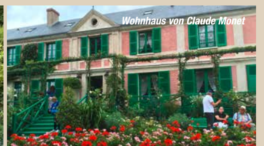
Wohnhaus von Claude Monet