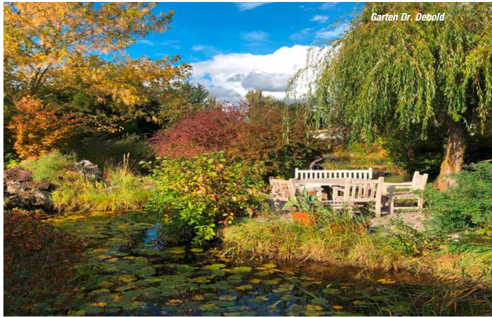
Garten Dr. Debold

15.08.: Morgenflug von Wien nach Berlin. Nach der Ankunft fahren Sie direkt in den Norden. Ihr erstes Ziel ist nur 2 km von der polnischen Grenze entfernt: der Pfarrgarten von Schwedt-Oder der Familie EHRlich. Seit 1988 ist sie hier wohnhaft und seit die fünf Kinder aus dem Haus sind, gehört die große Leidenschaft dem Garten. Hunderte Stauden, Sommerblumen und der Stolz, eine mehrere hundert Jahre alte Linde, dominieren den Garten und werden kreativ von der Frau des Pfarrers betreut. Unter der Linde wird Ihnen ein ländliches Frühstück,