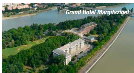
Grand Hotel Margitsziget

vielseitige Art und Weise mit zum Teil neu entdeckten trockenheitsverträglichen Pflanzen Beete im „Neuen pannonischen Stil“. Durch die naturnahe Gestaltung zeigt er, wie man Gärten in einem trockenen Klima besonders insektenfreundlich gestalten kann. Ein Feuerwerk an Blüten von vielen mediterranen und einheimischen pannonischen Pflanzen inmitten von Palmen und Mittelmeer Zypressen erwarten uns. Zum Abschluss gibt es noch einen typisch ungarischen Imbiss. Rückreise über Wien - Westautobahn - St. Pölten Süd - Amstetten - St. Valentin nach Linz und Wels. ■