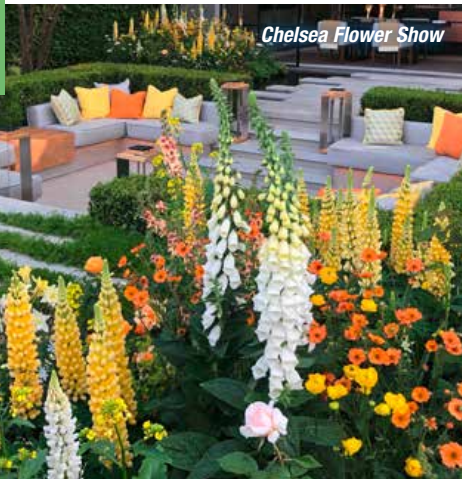
Chelsea Flower Show

Einige Male schon haben wir für unsere VIP-Gartenreisen die britische Hauptstadt als Reiseziel gewählt. Es stehen diesmal wieder neue, reizende Stadtgärten in der Metropole auf dem Programm, deren Besitzer Ihre Gartenpforte gerne für Sie öffnen. Natürlich besuchen Sie auch die immer populärer werdende Chelsea Flower Show und als Highlight erwartet Sie ein Besuch des königlichen Gartens von HRH Prince of Wales: Highgrove.