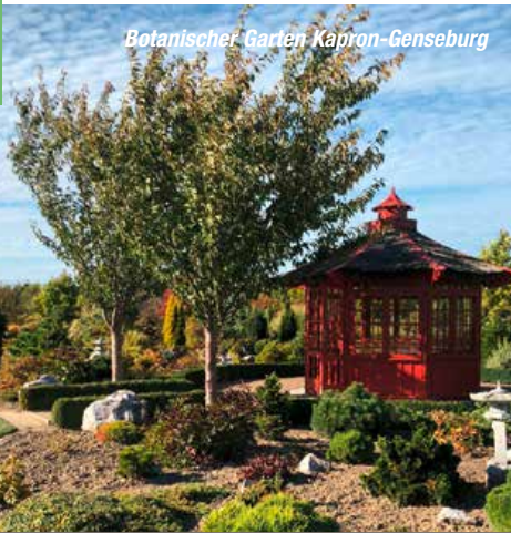
Botanischer Garten Kapron-Genseburg

Die Sommergartenreise 2019 führt Sie diesmal an die Ostsee in das Bundesland Mecklenburg-Vorpommern. Hier ist nicht nur die Aktion „Natur im Garten“ daheim, hier findet man endlose Naturlandschaften, ländliche Idylle, Sammlergärten, private Landschaftsparks und Künstlergärten. Das alles mit den typischen Zutaten einer Reise in diese Gegend: Strandkorb, Meer und kulinarische Delikatessen. Ihr Ausgangspunkt für das nördliche Gartenerlebnis ist die Ostseeinsel Usedom. Am Ufer des Meeres spüren Sie die Meeresbrise hautnah und erleben Tag für Tag die Leidenschaft der Menschen für den Garten – in allen Ausprägungen.