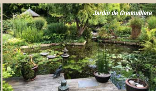
Jardin de Grenouillere