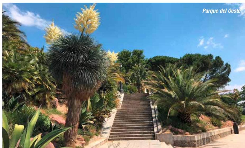
Parque del Oeste