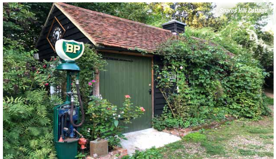
Snares Hill Cottage